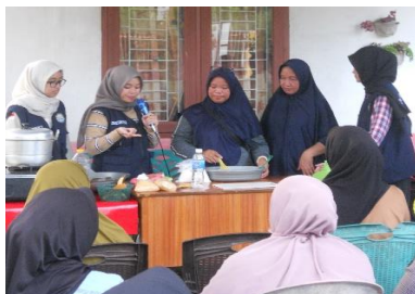
Gambar 2. Kegiatan Edukasi