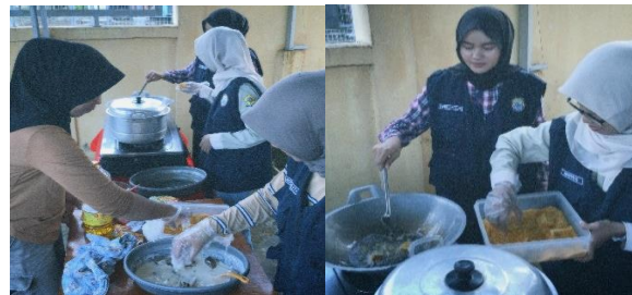
Gambar 3. Kegiatan Demo Masak