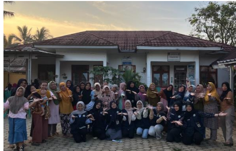
Gambar 1. Peserta Kegiatan

soal berisi 5 pertanyaan guna mengetahui pengetahuan awal peserta. Selanjutnya, dilaksanakan demo memasak, penyampaian materi, dan sesi tanya jawab untuk memperkuat pemahaman. Sebagai penutup, dilakukan post-test untuk mengevaluasi peningkatan pengetahuan peserta setelah mengikuti kegiatan.